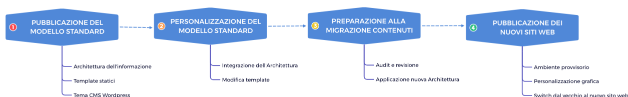
Fig.1 – Articolazione in moduli dell’Offerta